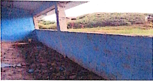
Foto. Todo por el interior polvado y se ve muy feo el la pared.