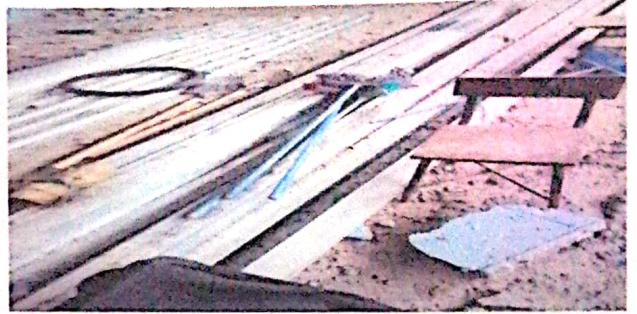
Foto 2: todos los inmuebles sin orden de que por falta el mejoramiento del establecimiento.