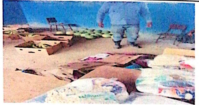
Foto 6: Al momento de entrega de viveres a los padres de familia casi todo esta en desorden.

Observación: Si es necesario se pueden agregar hojas adicionales, facturar el número de hojas.