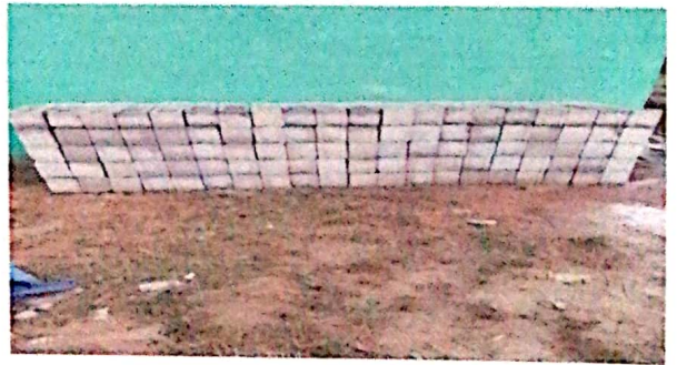
Foto 4: luego de no haber iniciado el trabajo así estaba la pared y no hay protección de materiales.