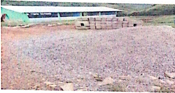
Foto 1 antes así estaba la escuela.